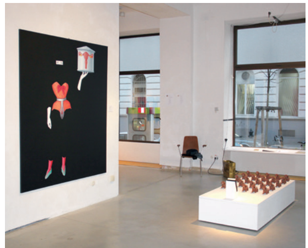
Ansichten der Ausstellung