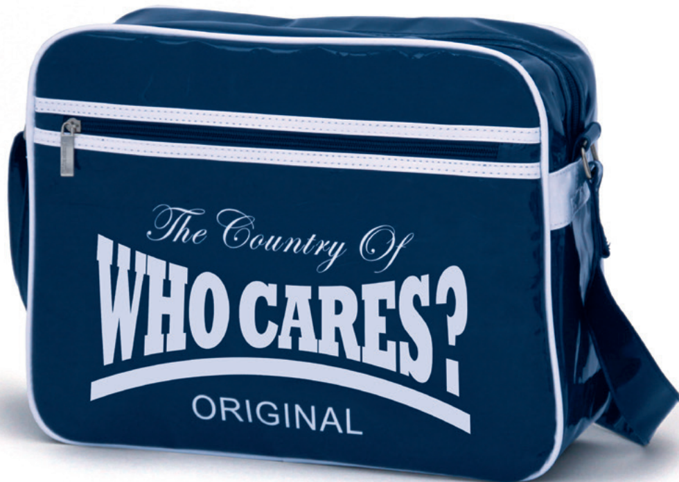
Originals III + IV je 37 x 30 x 12 cm Mixed Media