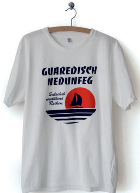
No sense at all II - V Dimensionen variabel Mixed Media