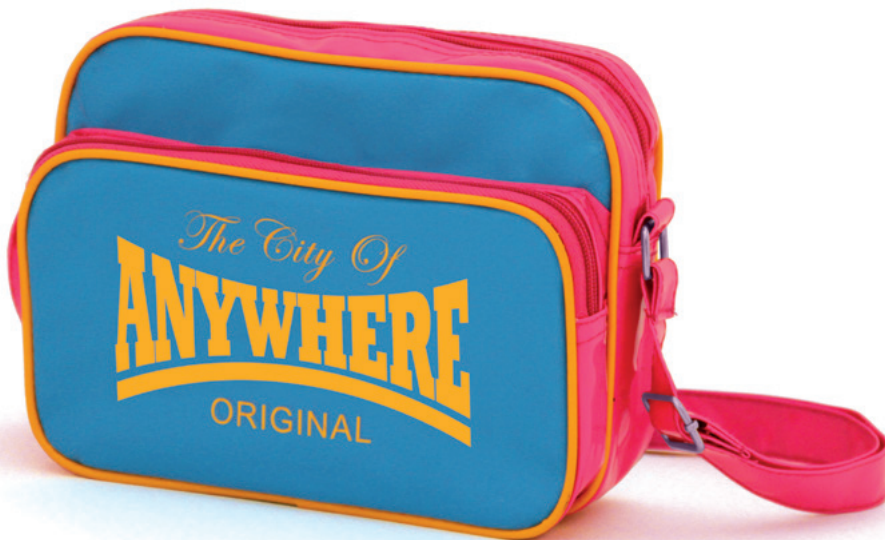
Originals I + II je 24 x 19 x 10 cm Mixed Media