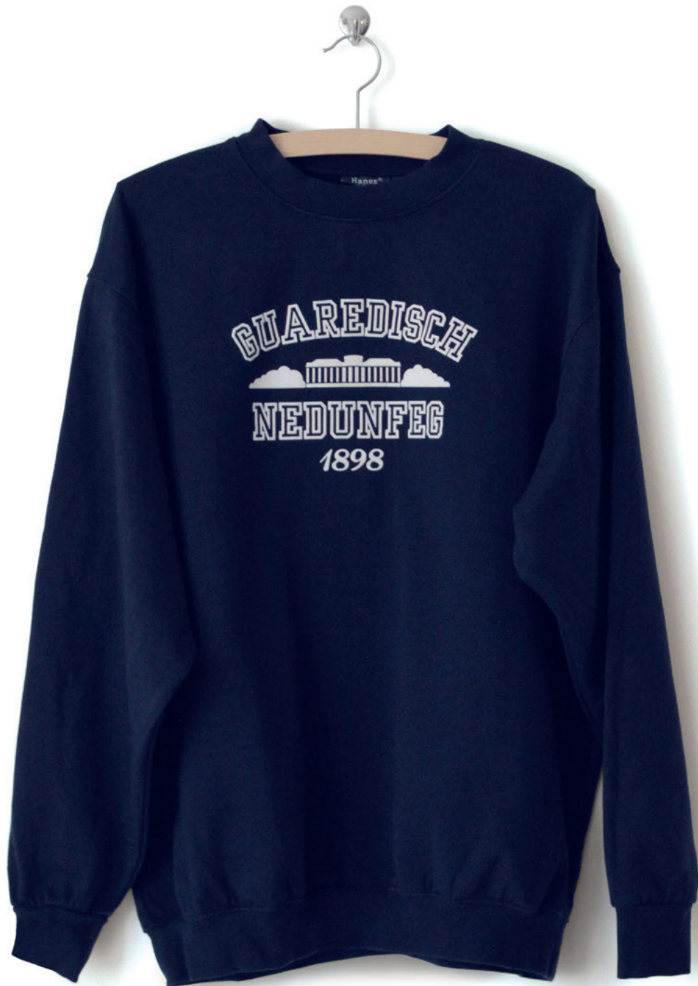
No sense at all I Dimensionen variabel Mixed Media